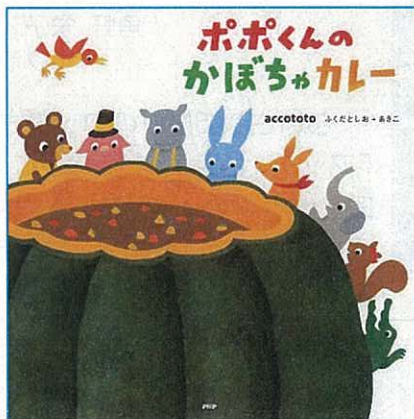
『ポポくのかぼちゃカレー』 ふくだとしお+あきこ/さく PHP研究所

どうぶつたちが みんなで つくった かぼちゃのカレー。 とっても おいしくて 「おかわり！」の こえが あちらこちらから きこえてきます。