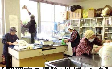
【調理室の掃除：地域センタ】