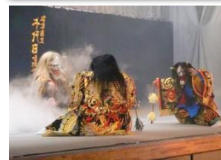
↑千代田高校神楽愛好会