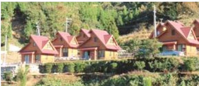
山口県周防大島町のクラインガルテン施設