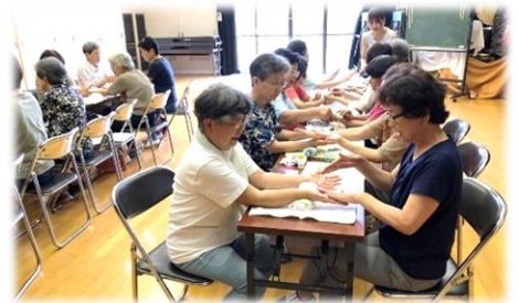
アロマハンドマッサージの様子